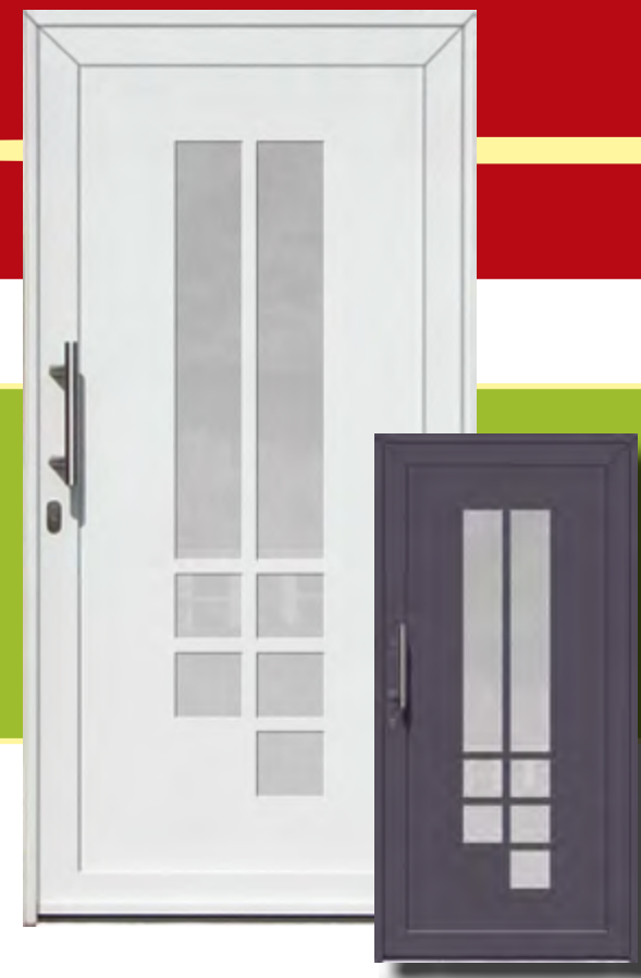
Heidelberg Iso-Wärmeschutzglas mit Mastercarree oder Satinato weiß