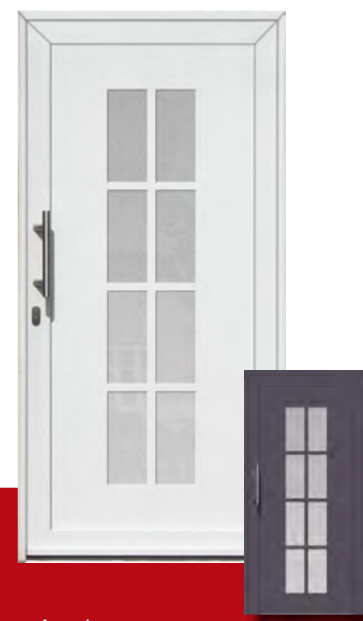
Augsburg Iso-Wärmeschutzglas mit Mastercarree oder Satinato weiß