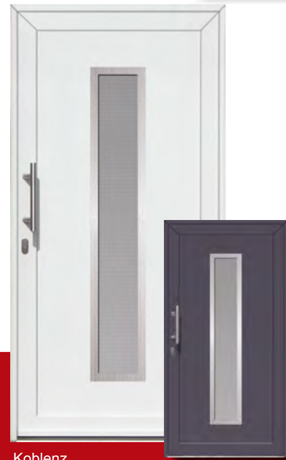
Koblenz Iso-Wärmeschutzglas mit Mastercarree oder Satinato weiß