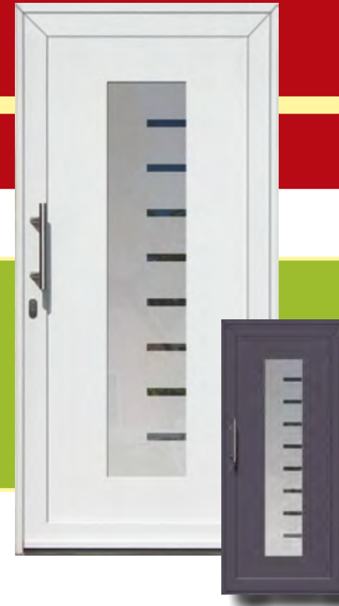
Kassel Iso-Wärmeschutzglas mit Mastercarree oder Satinato weiß Sonderausstattung Glasmotiv G 9010