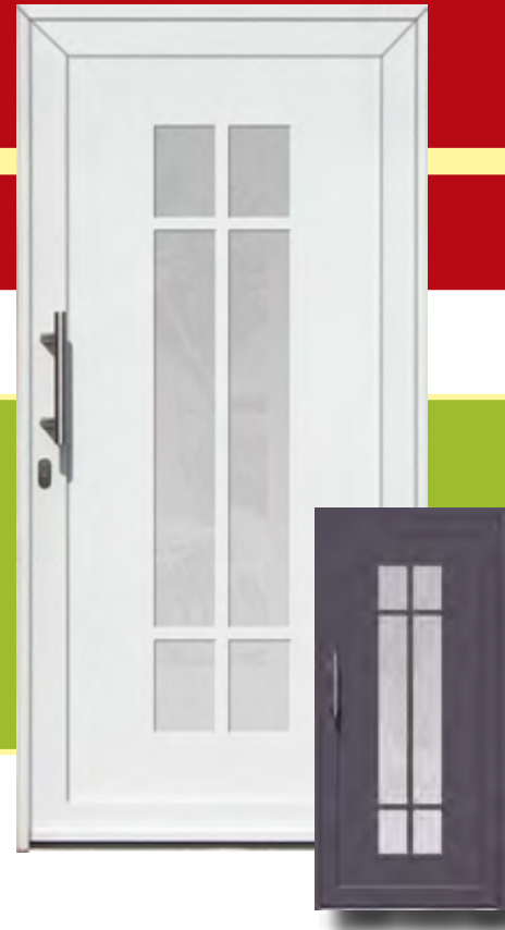
Berlin Iso-Wärmeschutzglas mit Mastercarree oder Satinato weiß