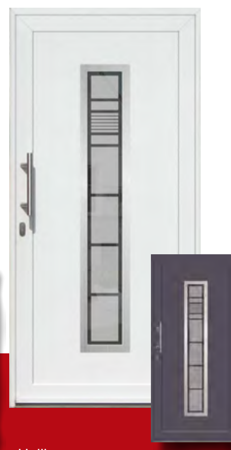
Heilbronn Iso-Wärmeschutzglas mit Mastercarree oder Satinato weiß Sonderausstattung Glasmotiv G 8020