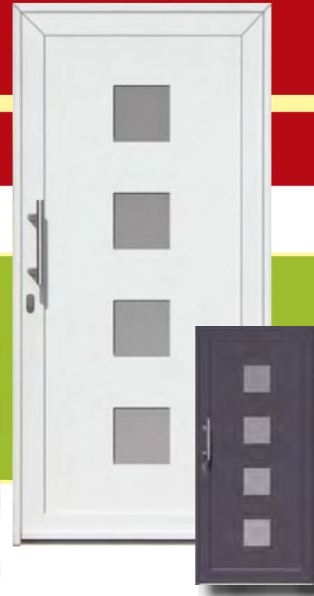
Aachen Iso-Wärmeschutzglas mit Mastercarree oder Satinato weiß