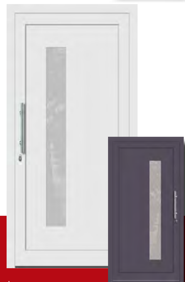
Jever Iso-Wärmeschutzglas mit Mastercarree oder Satinato weiß