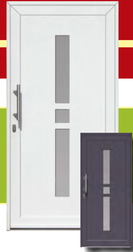
Leipzig Iso-Wärmeschutzglas mit Mastercarree oder Satinato weiß