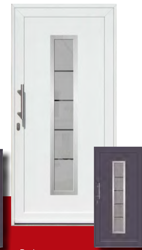
Borkum Iso-Wärmeschutzglas mit Mastercarree oder Satinato weiß Sonderausstattung Glasmotiv G 8030