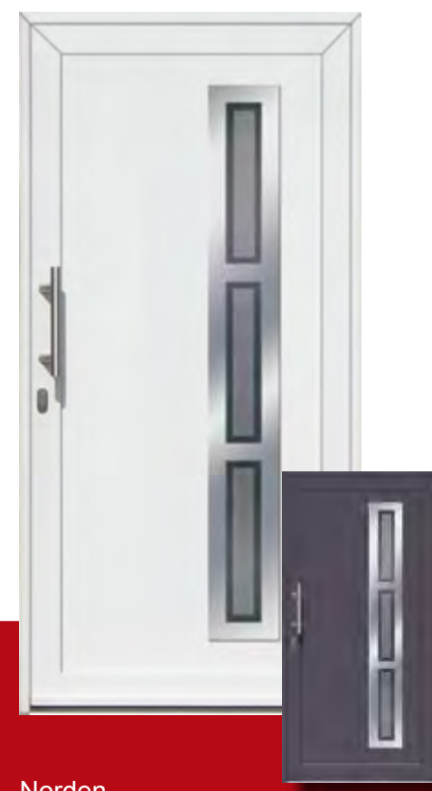
Norden Iso-Wärmeschutzglas mit Mastercarree oder Satinato weiß Sonderausstattung Glasmotiv G 9020