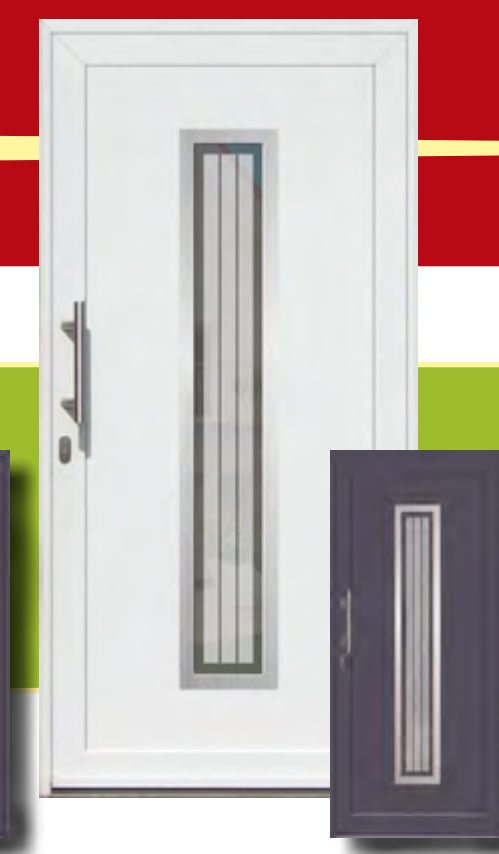
Hildesheim Iso-Wärmeschutzglas mit Mastercarree oder Satinato weiß Sonderausstattung Glasmotiv G 8050