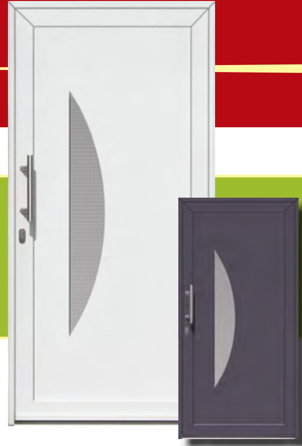
Freiburg Iso-Wärmeschutzglas mit Mastercarree oder Satinato weiß