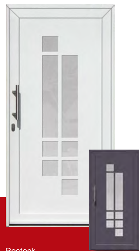
Rostock Iso-Wärmeschutzglas mit Mastercarree oder Satinato weiß